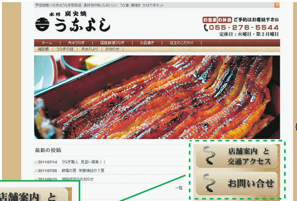
Word Pressを使ったHPの例 (http://kabayaki.net/)